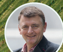
Reiseleitung: Rainer Luf

Erleben Sie Ptuj, eingebettet in die zauberhafte Štajerska, Sloweniens Weinregion von unvergleichlicher Schönheit. Die historische Stadt beherbergt nicht nur kulturelle Schätze, sondern auch prämierte Weingüter wie „Dveri Pax“ in Jarenina. Das Grand Hotel Primus bietet nicht nur erholsamen Luxus, sondern auch Zugang zu einer reichen Wellness-Tradition. In der Štajerska offenbart sich die Vielfalt von Ptuj, begleitet von Honigverkostungen, Weinbergen und der künstlerisch beeindruckenden Kirche der schmerzhaften Gottesmutter in Ormož. Tauchen Sie ein in die Wein- und Kulturlandschaft der Štajerska